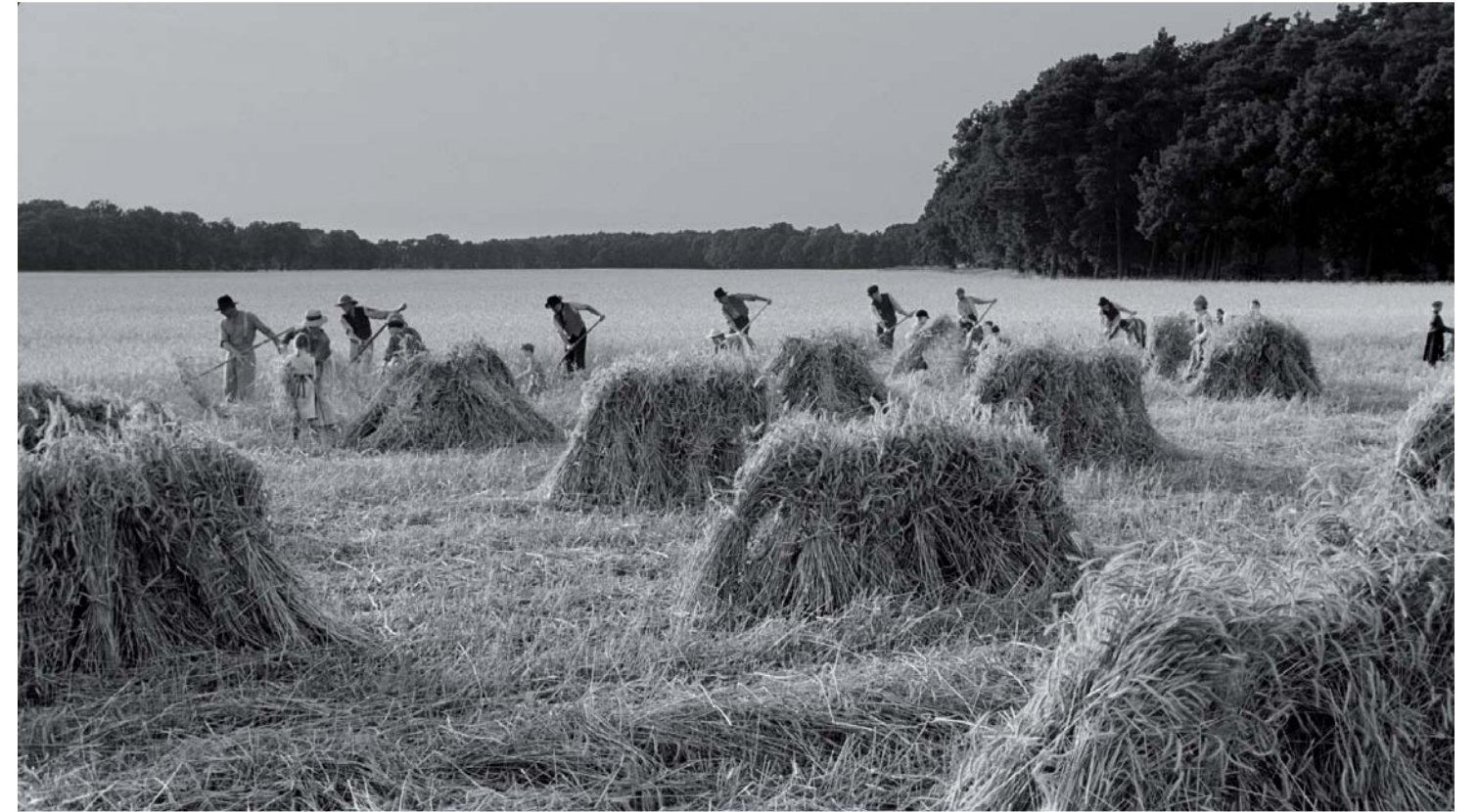
1913/14. Vorabend des Ersten Weltkriegs.